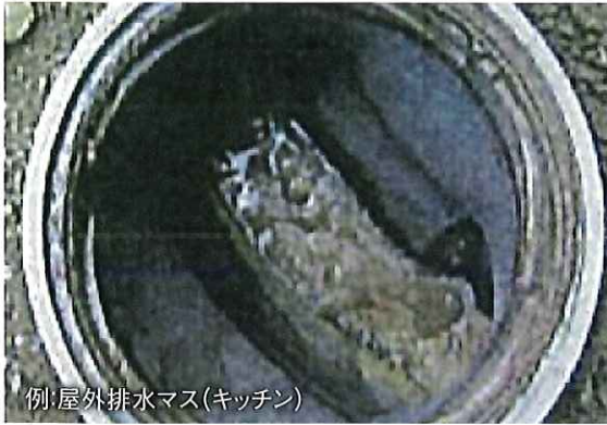
例: 屋外排水マス(キッチン)