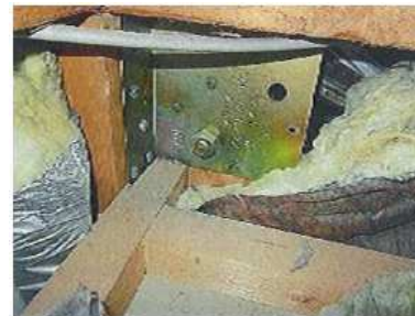
<ボルト固定の筋かい金物>

ボルト固定の筋かい金物が設置されている柱に耐震性を向上させるための柱頭柱脚金物を設置する場合、筋かい金物を外す必要があります。今回開発した金物を利用すると、この作業が必要なくなり、安全性の向上と1箇所あたり1時間程度の作業時間の短縮になります。